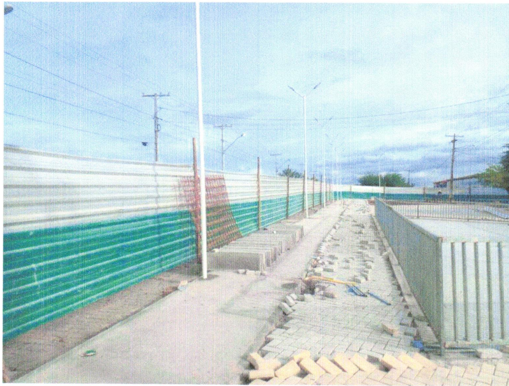
Foto 09- POSTE DE DUAS PÉTALAS EM AÇO PINTADO NA COR BRANCA - ALTURA 6.00 m - LÂMPADA LED 40W