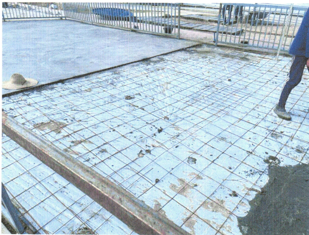
Foto 05 - APLICAÇÃO DE LONA PLÁSTICA PARA EXECUÇÃO DE PAVIMENTOS DE CONCRETO. AF_04/2022