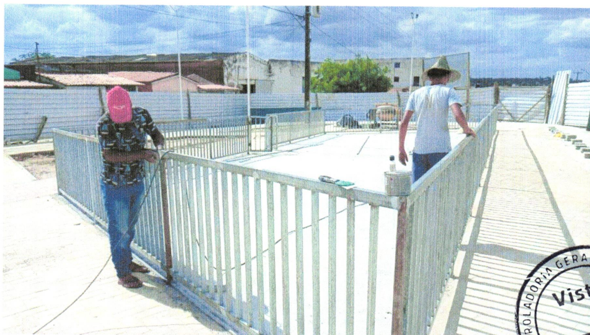
Foto 08 - GRADE EM METALON