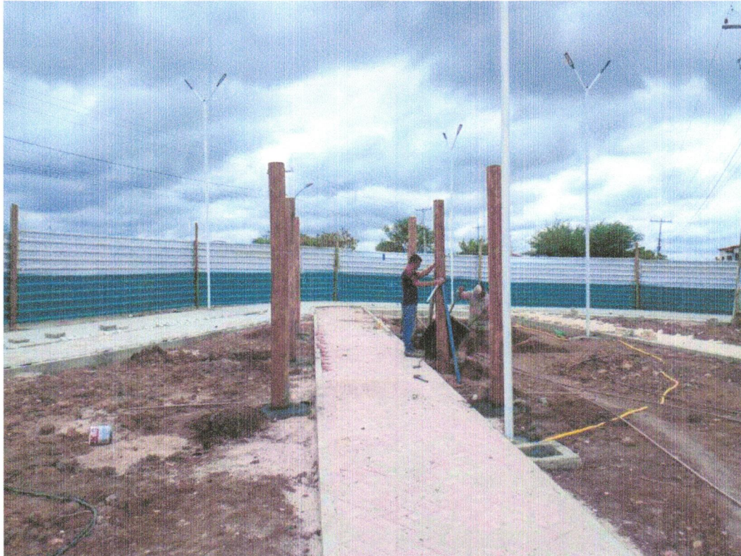
Foto 13 - Fornecimento e assentamento de peças de eucalipto tratado, d=25 a 30cm