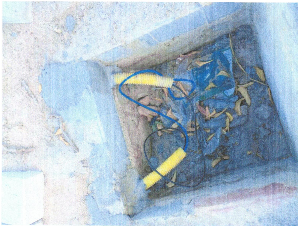
Foto 11- CABO DE COBRE FLEXÍVEL ISOLADO, 2,5 MM 2 , ANTI-CHAMA 0,6/1,0 KV, PARA CIRCUITOS TERMINAIS - FORNECIMENTO E INSTALAÇÃO. AF_12/2015