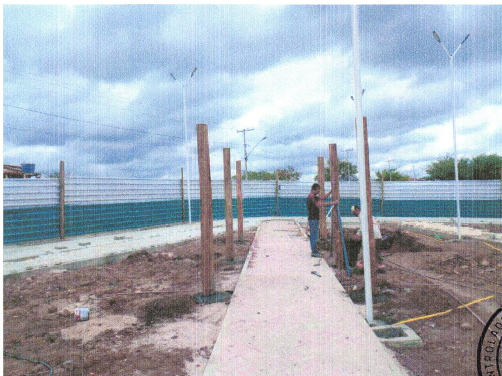
Foto 14 - CONCRETO MAGRO, APLICADO EM BLOCOS DE COROAMENTO OU SAPATAS. AF_08/2017