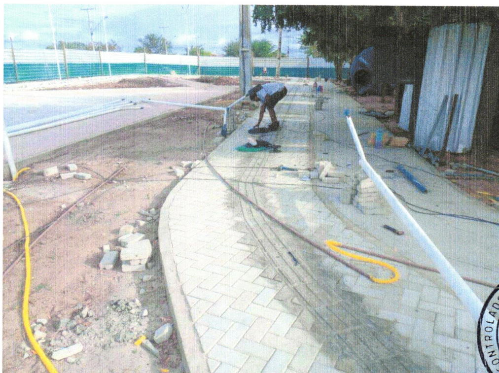
Foto 04 - Piso tátil direcional e/ou alerta, de concreto, colorido, p/deficientes visuais, dimensões 25x25cm, aplicado com argamassa industrializada ac-ii, rejuntado, exclusive regularização de base