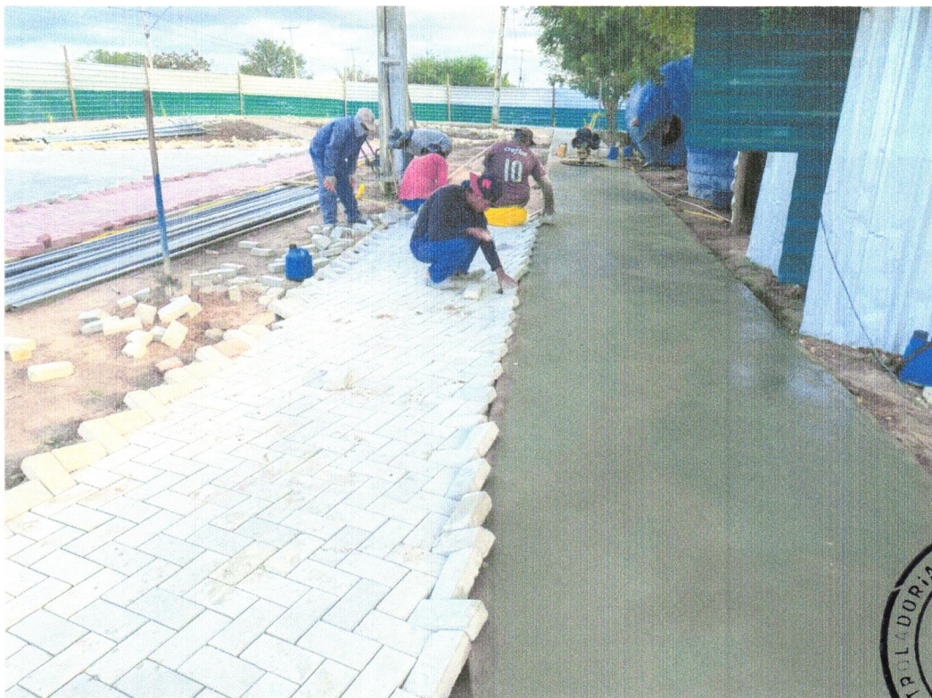
Foto 02 – EXECUÇÃO DE PASSEIO EM PISO INTERTRAVADO, COM BLOCO RETANGULAR COR NATURAL DE 20 X 10 CM, ESPESSURA 6 CM. AF_12/2015