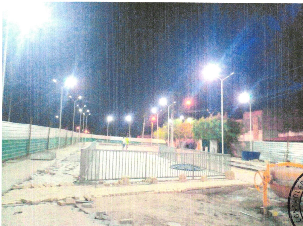
Foto 10 - POSTE DE DUAS PÉTALAS EM AÇO PINTADO NA COR BRANCA - ALTURA 6.00 m - LÂMPADA LED 40W