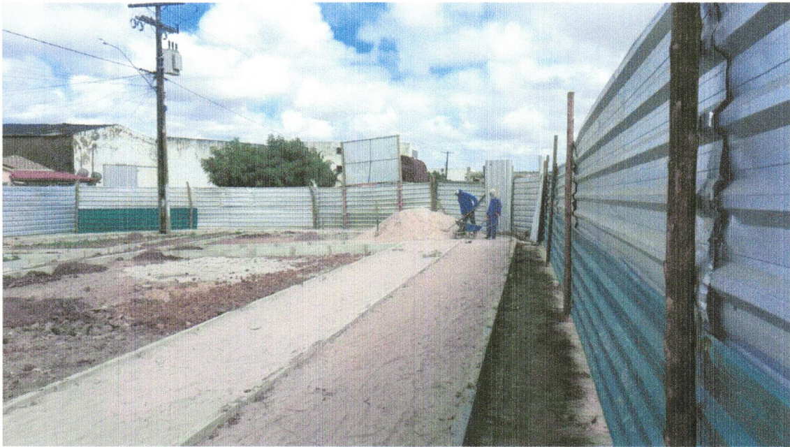
Foto 01 - ATERRO C/COMPACTAÇÃO MECÂNICA E CONTROLE, MAT. DE AQUISIÇÃO