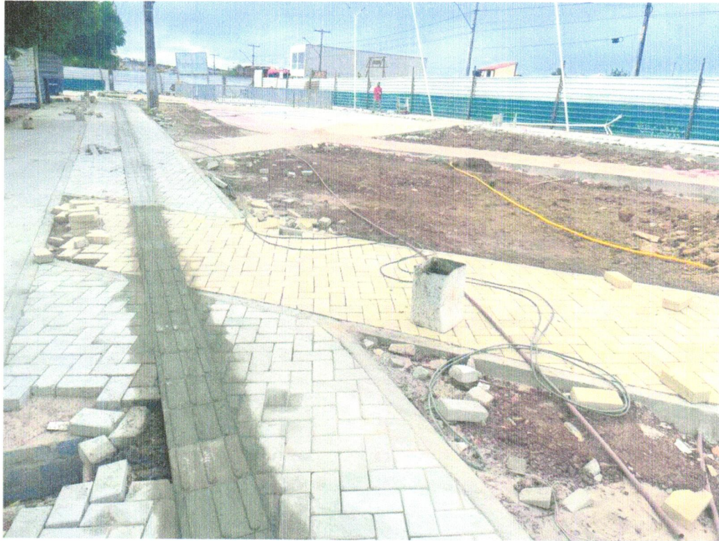
Foto 03- Piso tátil direcional e/ou alerta, de concreto, colorido, p/deficientes visuais, dimensões 25x25cm, aplicado com argamassa industrializada ac-ii, rejuntado, exclusive regularização de base