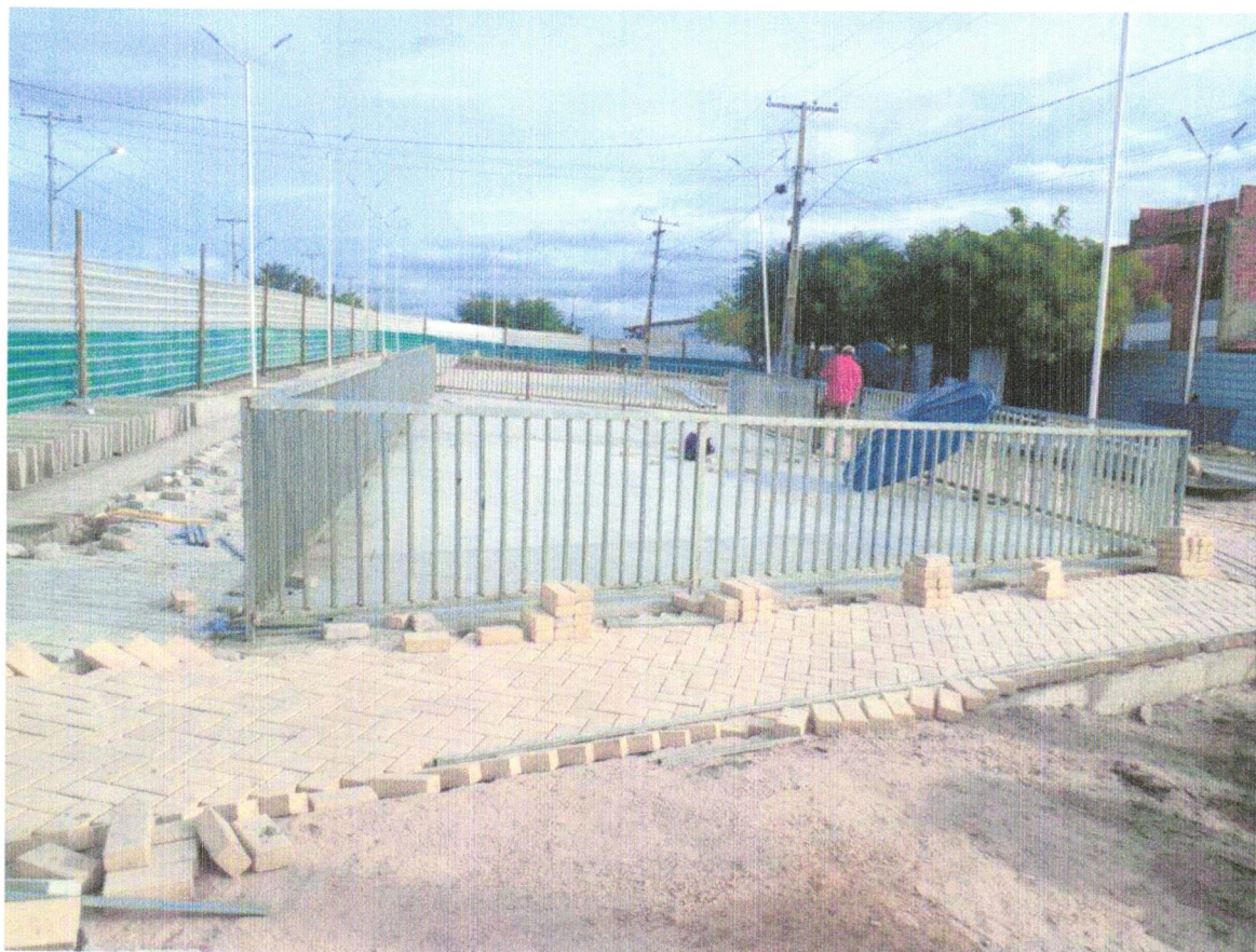
Foto 07 - GRADE EM METALON