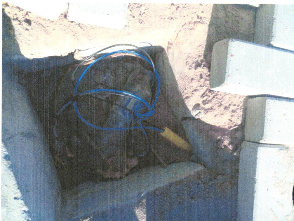
Foto 12 - CABO DE COBRE FLEXÍVEL ISOLADO, 2,5 MM 2 , ANTI-CHAMA 0,6/1,0 KV, PARA CIRCUITOS TERMINAIS - FORNECIMENTO E INSTALAÇÃO. AF_12/2015